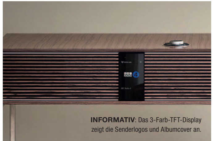
INFORMATIV: Das 3-Farb-TFT-Display zeigt die Senderlogos und Albumcover an.

AirPlay und Google Chromecast ist das Ruark R810 multiroom-fähig. Nutzer können ihre Musik nahtlos in verschiedenen Räumen ihres Zuhauses streamen und so ein einheitliches Klangerlebnis genießen.