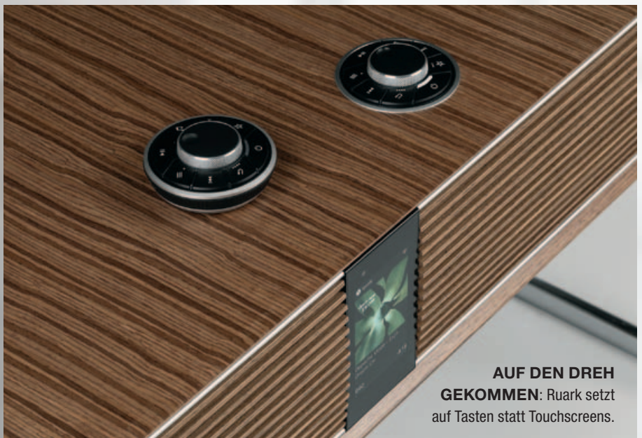
AUF DEN DREH GEKOMMEN: Ruark setzt auf Tasten statt Touchscreens.