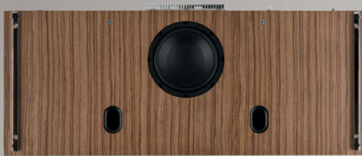
DOWN FIRE: Die beiden Bassreflexöffnungen sind übrigens nicht für den 20-cm-Subwoofer.

Unterstützt wird das Bedienkonzept von einem 4-Farb-TFT-Display auf der Frontseite der Musiktruhe, die sich auf Sideboards oder auf dem optionalen schicken, hochglänzenden Stahlrahmen aufstellen lässt. Allerdings reagiert das Display nicht auf Touch-Befehle, was es andererseits vor Fingerabdrücken bewahrt. Die Verarbeitung des R810 ist sehr hochwertig. Das 27 Kilogramm schwere High-Fidelity-Radiogram wirkt wie ein Möbelstück,