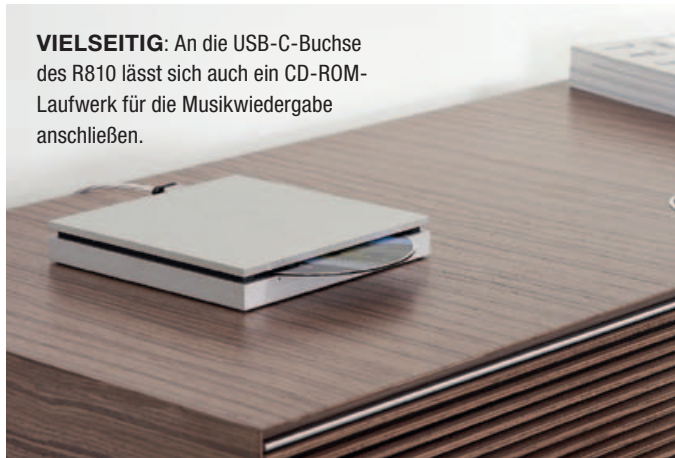
VIELSEITIG: An die USB-C-Buchse des R810 lässt sich auch ein CD-ROM-Laufwerk für die Musikwiedergabe anschließen.