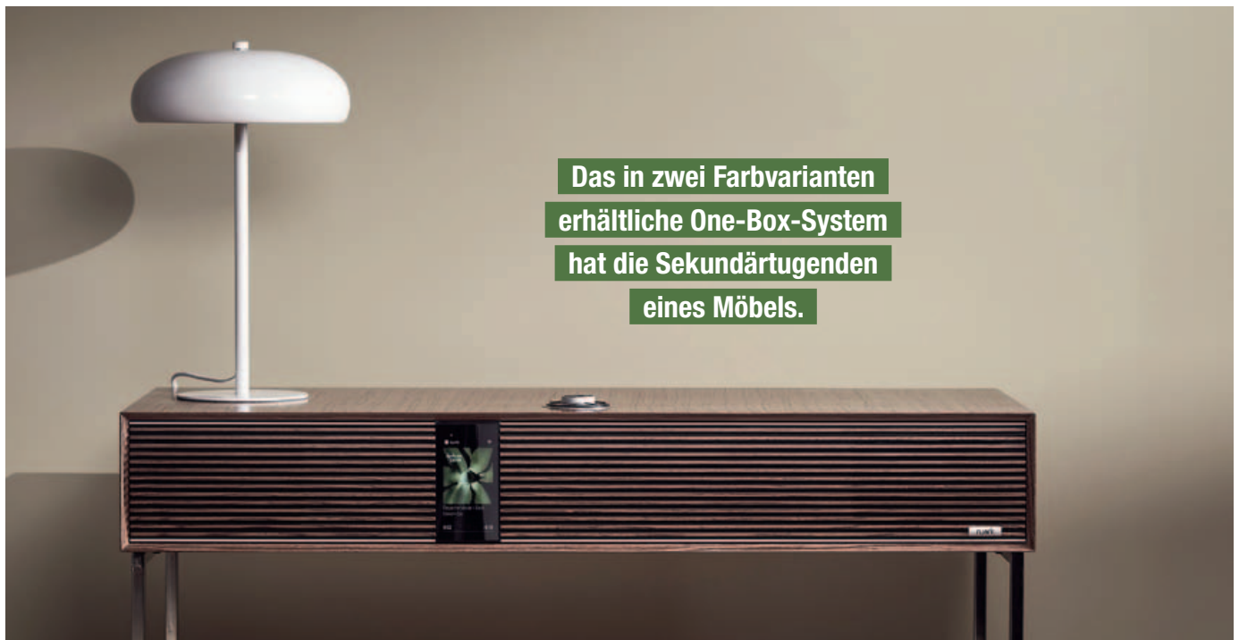
Das in zwei Farbvarianten erhältliche One-Box-System hat die Sekundärtugenden eines Möbels.

Die Musik löst sich nahezu mühelos vom Gehäuse, was zu einem authentischen und natürlichen Hörerlebnis führt. Ein weiterer herausragender Aspekt des Ruark R810 ist die Fähigkeit zu einer erstaunlich präzisen Stereoabbildung mit korrekter