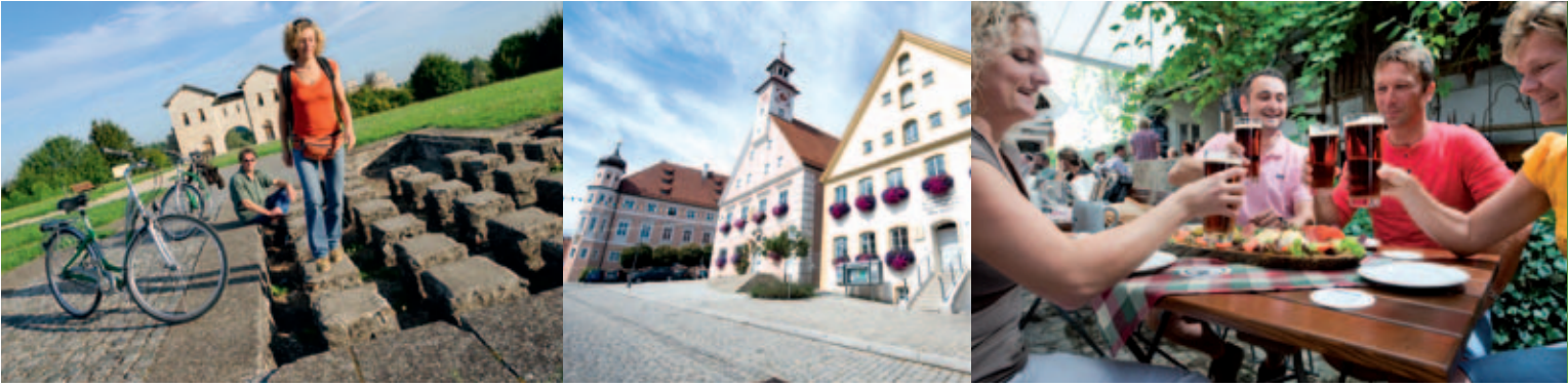
Kastell Biriciana in Weißenburg i. Bay. | Historische Altstadt Greding | Rast im Biergarten