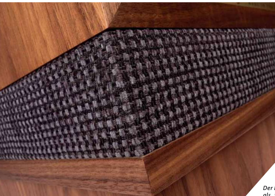
Der Bespannstoff geht als „very british“ durch

Darüberhinaus verfügt die Vintage Classic XII über ein in der Praxis sehr gut funktionierendes Klangregelsystem für den Hochtöner. Mittels zweier Drehknöpfe können der Pegel im Präsenz- und Hochtontbereich unabhängig voneinander und feinfühlig justiert werden. In Anbetracht der Auflösungs- und Durchzugsvermögens, dass der Druckkammertreiber an den Tag zu legen in der Lage ist, darf das als ausgesprochen gute Idee gelten. Während der „Energy“-Regler den gesamten Übertragungsbereich des Hochtöners abdeckt, beschränkt sich der „Presence“-Einsteller auf den besonders sensiblen Bereich um zwei Kilohertz. Bei den rückseitigen Bi-Wiring-Anschluss terminals hätte es in Anbetracht des ansonsten absolut makellosen Erscheinungsbildes des Lautsprechers eine etwas hochwertigere Variante sein dürfen, aber dafür gibt es auch gleich fünf Anschluss-