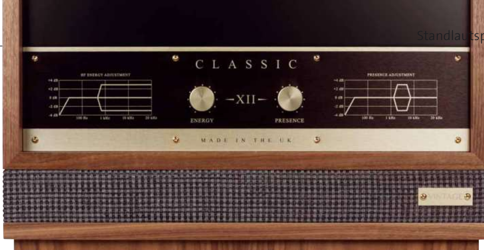
Die beiden Drehknöpfe ermöglichen eine feinfühligte Anpassung der Hochtonwiedergabe

Der in Schottland beheimatete Hersteller leistet sich übrigens gleich zwei Baureihen, die an die gute alte Lautsprecherzeit angelehnt sind, aber hier gilt es fein zu differenzieren: Die „Vintage“-Modelle sind der ganz harte Stoff. Das ist die Premium-Baureihe mit entsprechenden Preisschildern, kompromisslos in Sachen Technik und Vintage-Look. Die „Vintage Classic“-Modelle hingegen fußen auf den gleichen technischen Prinzipien, es kommt weitgehend das gleiche Material zum Einsatz, lediglich das Äußere geriet ein wenig schlichter.