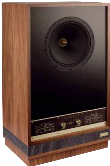
Die Fyne ist naturgemäß ein großer Lautsprecher, dessen Gestaltung aber sehr zu gefallen weiß

unten direkt an den Boden angekoppelt – das dürfte für einigen Schub in den tiefen Regionen sorgen.